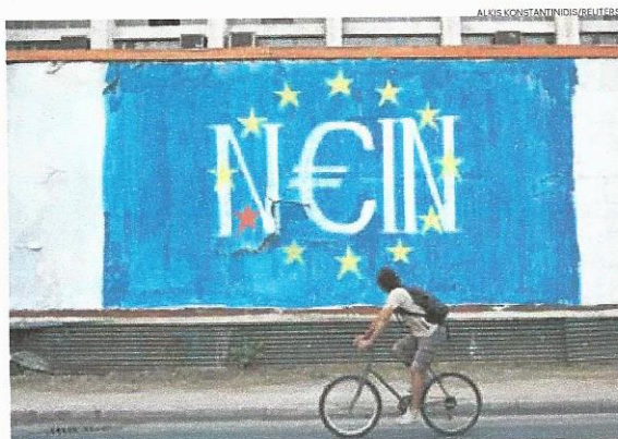
Discurso antieuropeísta tem vindo a crescer na União Europeia

Actualmente, diz, há pelo menos dez países da União que têm partidos de extrema-direita com discursos antieuropeístas com mais de 10% dos votos. Carlos Cipriano